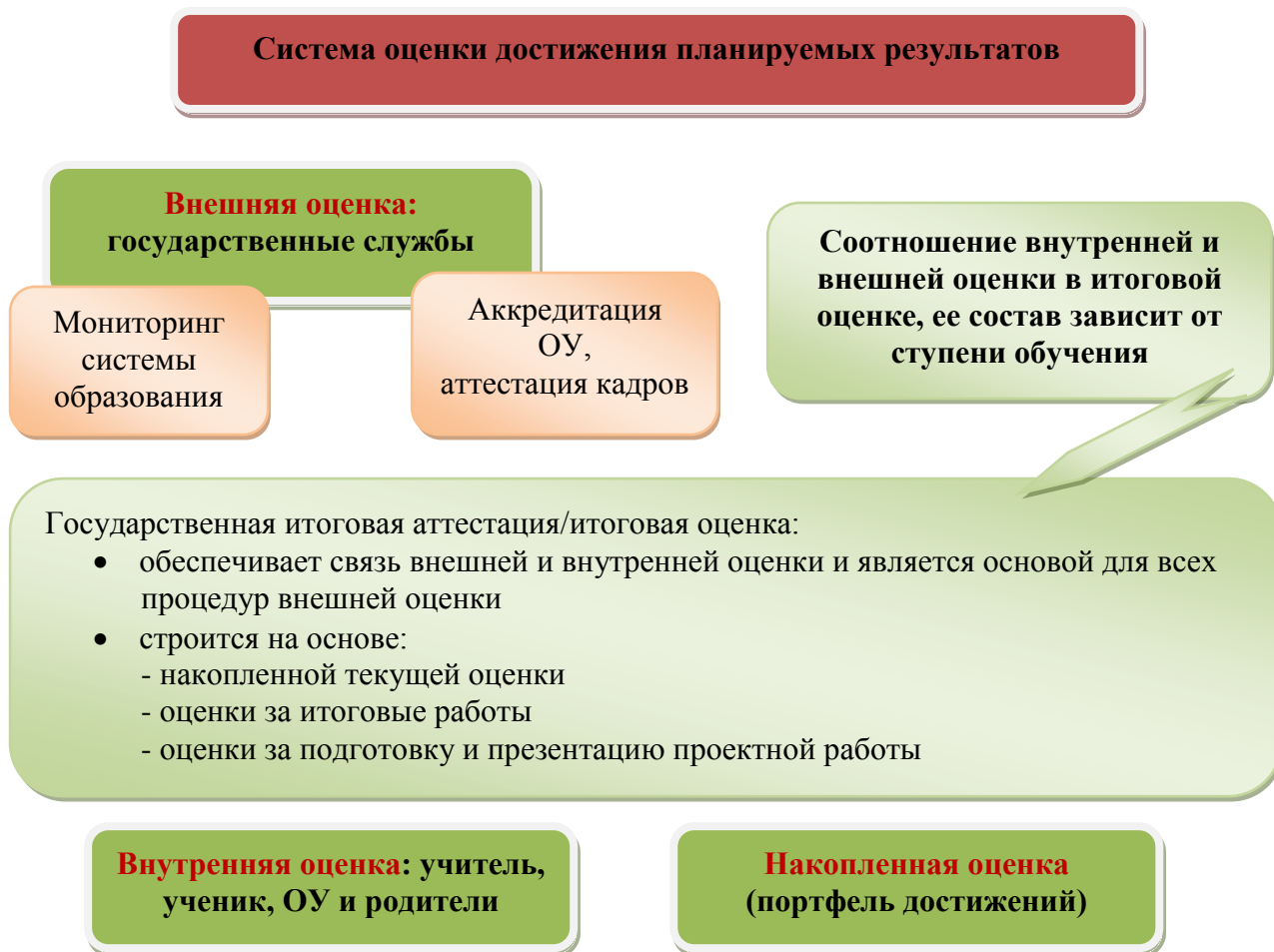
Рис. 2. Система оценки достижения планируемых результатов

Полученные данные используются для оценки состояния и тенденций развития системы образования разного уровня (рис. 2).