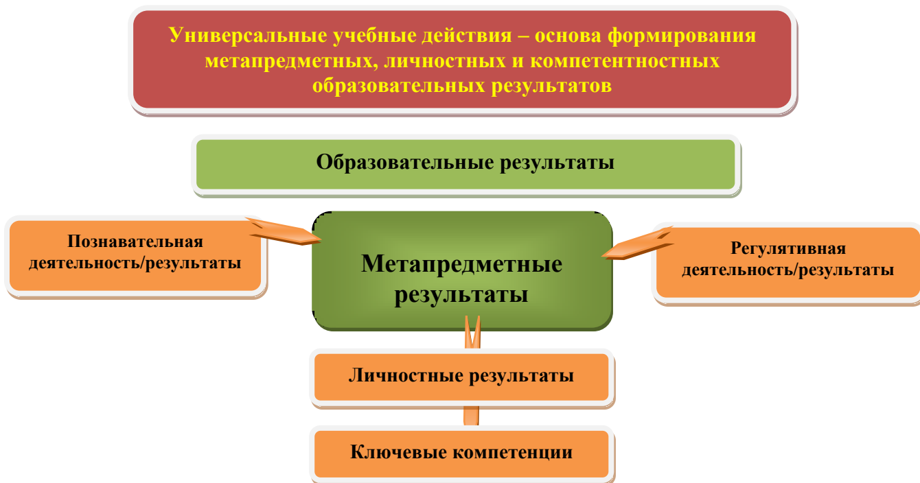
Рис. 3. Система оценки образовательных результатов

итоговая оценка обучающихся определяется с учётом их стартового уровня и динамики образовательных достижений.